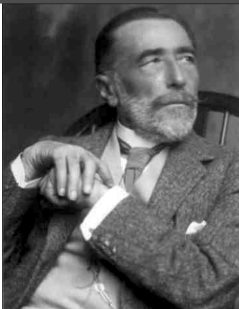
Teodor Józef Konrad Korzeniowski

Urodził się 3 grudnia 1857 r. w polskiej szlacheckiej rodzinie w Berdyczowie na Ukrainie. Życie miał tak barwne, jak i burzliwe. Mając cztery lata wyjechał w pierwszą, przymusową podróż w głąb Rosji - zesłanie ojca za działalność przeciwko caratowi. Z matką i jej bratem zamieszkali w Kijowie. Mając osiem lat, stracił ją i do czasu, aż wrócił ojciec, opiekował się nim brat matki - Tadeusz Bobrowski. Po powrocie ojca wrócili do